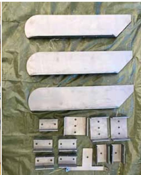
Medar till Isabella Kiss