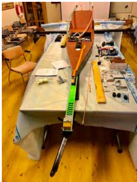
Isabella Kiss