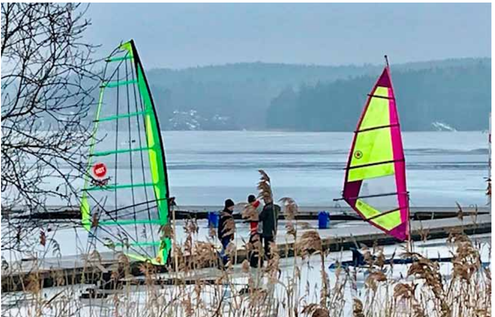
Isjakter istället för jollar