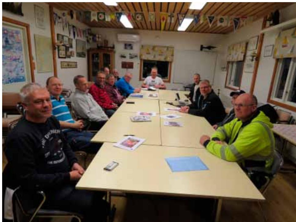
Det här trygga och kompetenta gänget tar hand om våra båtar.