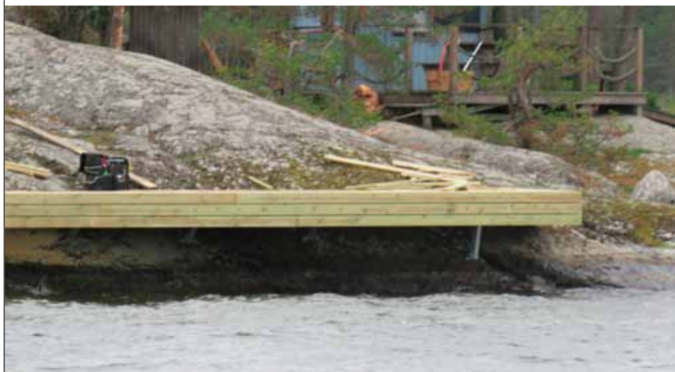
Nyrenoverad brygga i badviken.