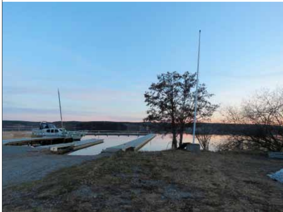
Än så länge lugnt i hamnen.