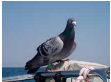
Nån som saknar duva nummer 83?