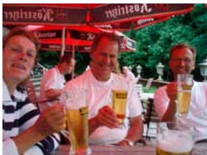
Glada miner trots blaskigt öl

Vilodag därefter i Vitte på Hiddensee. En riktig badort med milslånga stränder och sin egen kultur. Inga hotell eller höga hus, i stället små Gasthaus med halmtak, bilfritt, gott om cykeluthyrning, promenadvägar och riktiga möjligheter att åka hästskjuts. Det lokala ölet var väldigt tunt, men det fanns alternativ.