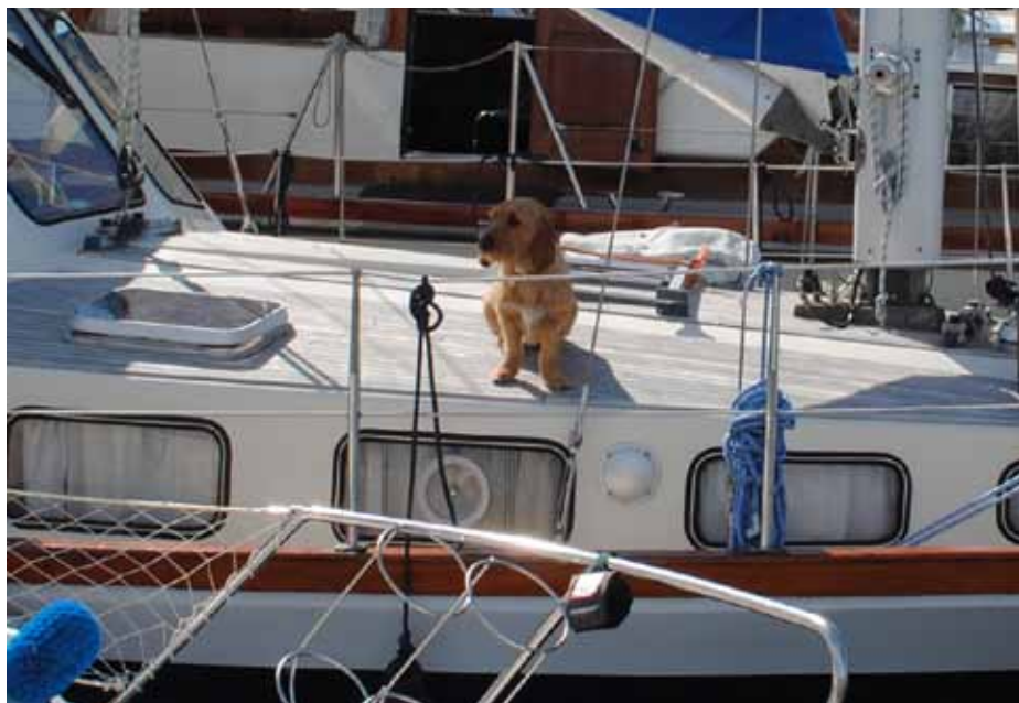
Var är alla?.

Lars Erik tackade för fika, visat intresse och engagemang samt förklarade årsmötet avslutat.