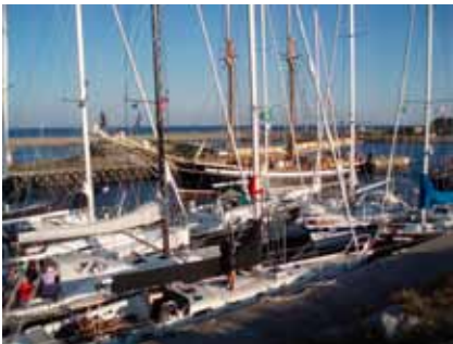
Elin anländer till Utklippan

Lite extra dramatiskt blev det på kvällen när segelskutan ”Elin” från Tjörn kom in i den till synes fulla hamnen och lugnt o elegant förtöjde på en reserverad bit kajkant.