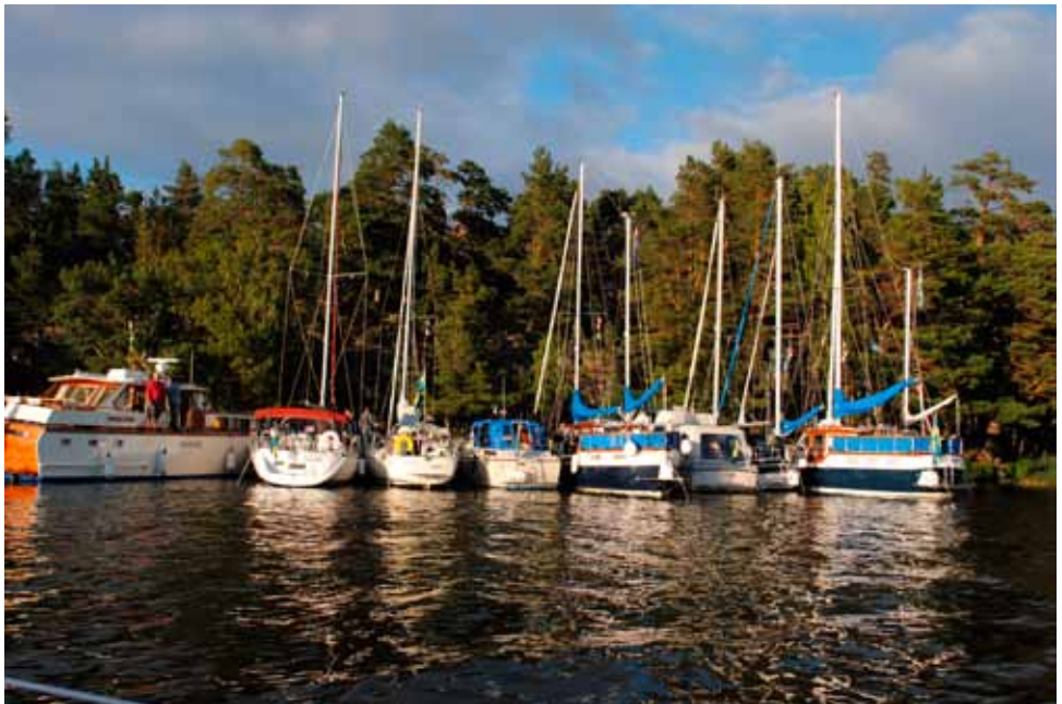
Fullproppat vid södra bryggan på eskaderns första kväll.