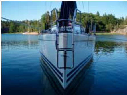
Den raka stäven