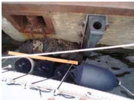
Bra med bräda ibland.

Bra att ha med en bräda för att skydda fendrarna mot otäcka grejer på kajkanterna. Nästa gång ska vi ha med oss en stor rund fender för att underlätta när man ska lägga ut och behöver vrida ut för eller akter. Bogpropeller är ju väldigt populärt, men är – i likhet med rullstor – otänkbart för en seglare. Bara så ni vet.